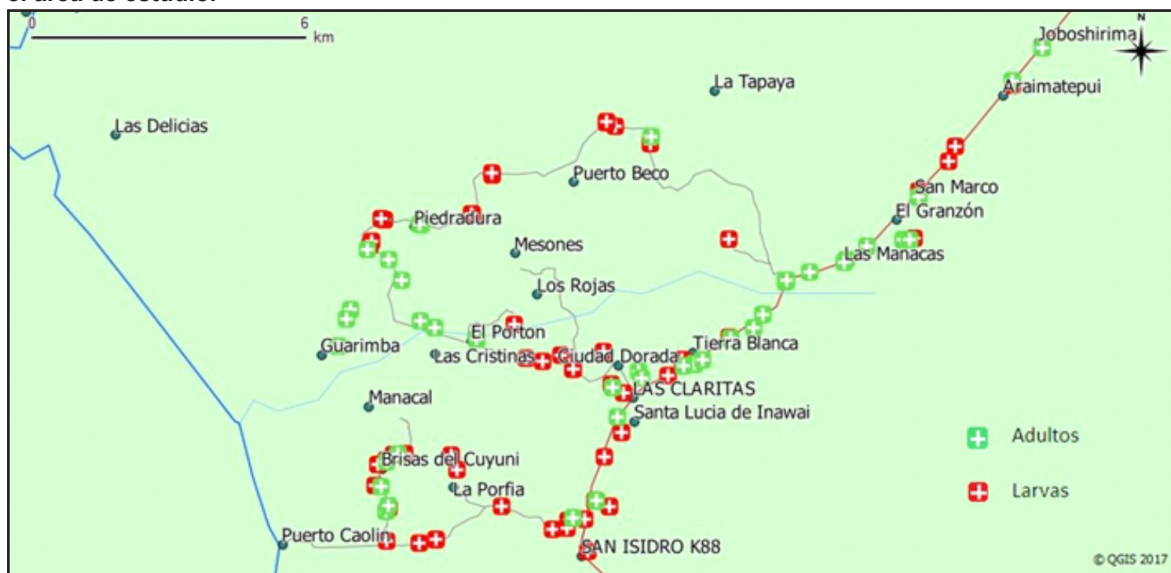
Fig. 2. Sitios de colecta de larvas de anofelinos y trampas Mosquito Magnet para mosquitos adultos en el área de estudio.

En la Tabla III se resumen los resultados del muestreo de hábitats larvarios de anofelinos realizado en los tres sectores, por localidad y especie de mosquito, todas ya reportadas para el municipio por Moreno et al. (2000. Op. cit. , 2015a. Op. cit. ). En total se recolectaron 847 larvas pertenecientes a seis especies de anofelinos, siendo las más abundantes An. albitarsis s.l. con 244 (28.8%) larvas recolectadas y An. triannulatus s.l. con 216 (25.5%), seguidas de An. darlingi con 77 (9.1%) larvas, An. nuneztovari s.l. 58 (6.8%), An. strodei 53 (6,3%) y An. oswaldoi s.l. con solo 8 larvas recolectadas, mientras que 191 (22.5%) larvas no pudieron ser identificadas por diversos motivos. En cuanto a la distribución y frecuencia de las especies, 13 localidades en los tres sectores resultaron positivas a larvas de anofelinos, siendo